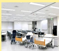
ウィリング横浜 介護実習室